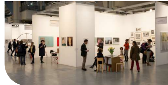
Kültür ve Sanat Merkezleri